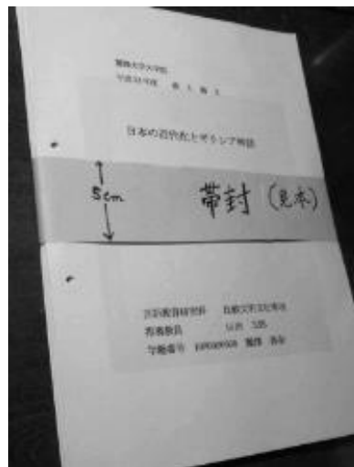
(b) 斜めから見た論文の「帯封」