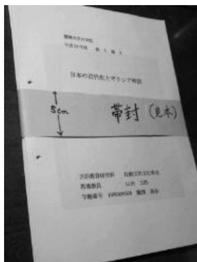
(b) 斜めから見た論文の「帯封」